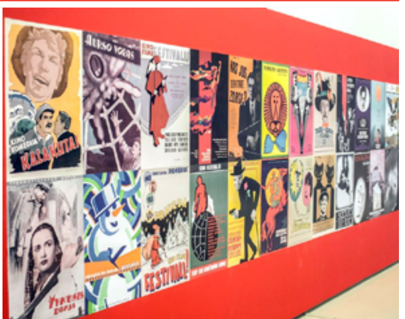
Фото с пресс-конференции и с выставки Павла Жукова, специально для «Обзора»