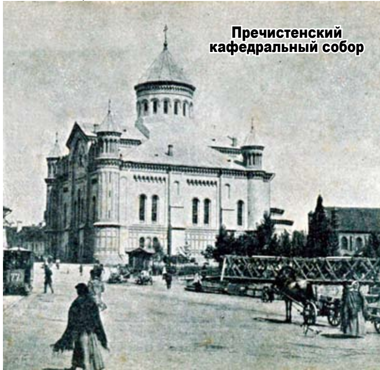
Пречистенский кафедральный собор