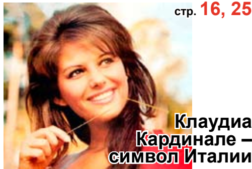
Клаудиа Кардинале – СИМВОЛ Италии