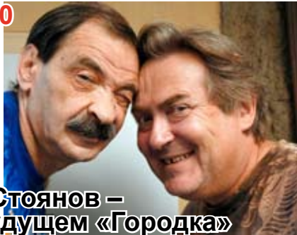
Ю. Стоянов – о будущем «Городка»