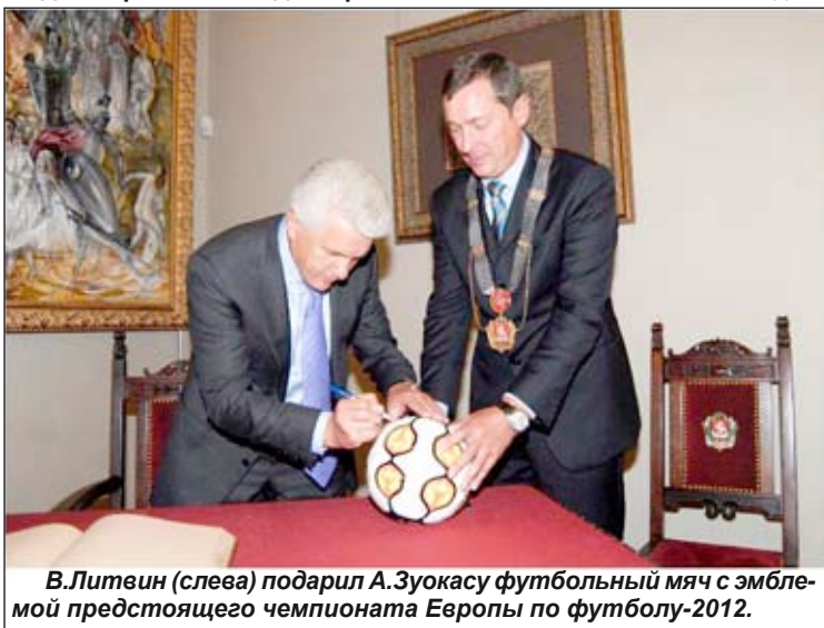
В. Литвин (слева) подарил А. Зуокасу футбольный мяч с эмблемой предстоящего чемпионата Европы по футболу-2012.

В. Литвин с А. Зуокасом обсудили также деловое сотрудничество, руководители, в частности, говорили и об условиях улучшения ведения бизнеса в Украине.