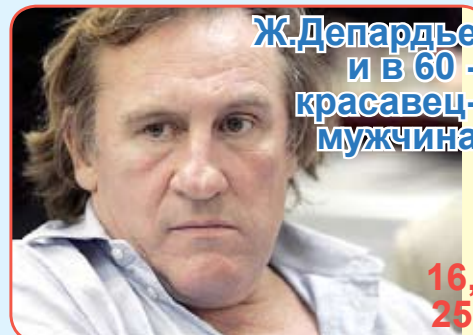
Ж.Депардьё и в 60 - красавец-мужчина