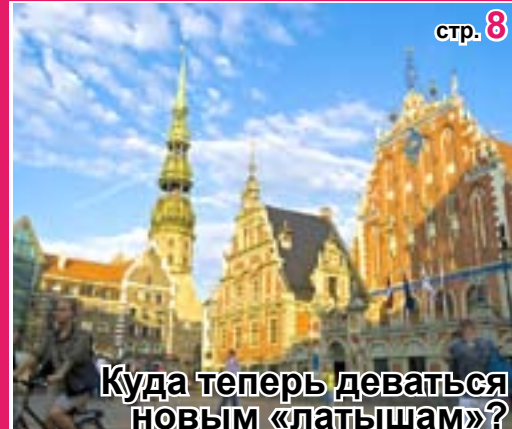
Куда теперь деваться новым «латышам»?